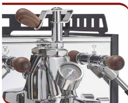
Flow control device

Korpus und Rahmen aus Edelstahl AISI 304, verfügbare Farben: Edelstahl, mattschwarz mit Holz-Finish, weiß und rot.